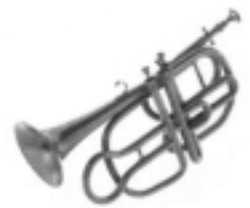
Stölzelventil-Trompete in F MUSIKinstrumentenMUSEUM Schloss Kremsegg

Der Tonumfang der Trompete umfasste noch im späten Mittelalter nur die im tiefen Bereich liegenden Naturtöne 1-4. Im 15. Jahrhundert war auch schon eine Zugtrompete in Gebrauch. Im Zuge der Versuche, den Tonvorrat der Naturtrompete zu vergrößern, um sie insbesondere im mittleren Register und in der Tiefe melodisch einsetzen zu können, wurde um 1770 die beim Horn angewandte