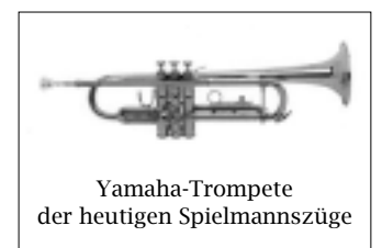
Yamaha-Trompete der heutigen Spielmannszüge

Das Ende der Kavallerietrompete kam – technisch gesehen – mit der Erfindung der Ventile durch Blümel und Stölzl 1813, wodurch die Trompete eine vollchromatische Tonskala erhielt. Obwohl man ihr zunächst skeptisch begegnete, setzte sich die seit 1830 in ihrer heutigen Form mit drei Ventilen ausgestattete Trompete bald durch.