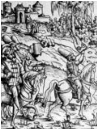
Meister HM: Szenen aus dem Leben Johann Friedrichs des Großmütigen, ca. 1554

Im frühen Mittelalter haben die Heerführer ihr Signalhorn selbst geblasen, wie es von Roland und seinem Hifthorn (oder Hiefhorn, von ahd. hiofan , „wehklagen“), ein aus einem Rinderhorn gefertigtes Signalinstrument, bekannt ist. Später übernahm der