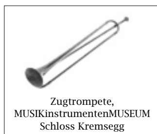
Zugtrompete, MUSIKinstrumentenMUSEUM Schloss Kremsegg

Bevor ein Trompeter vor versammeltem Regiment seine Prüfung zum Feldtrompeter ablegen konnte, musste er allerdings eine fünfjährige Lehrzeit und zwei weitere Jahre Unterricht bei einem Feldtrompeter hinter sich gebracht haben. Die Ausbildung mussten der Regimentsinhaber und der König zu gleichen Teilen tragen. Als Friedrich Wilhelm III. von Preußen im Jahre 1810 wiederum für fünf Karoliner das Lehrgeld entrichten sollte, war es dem Sparsamen zuviel. Mit königlicher Verordnung löste er die stolze Zunft der Trompeter auf.