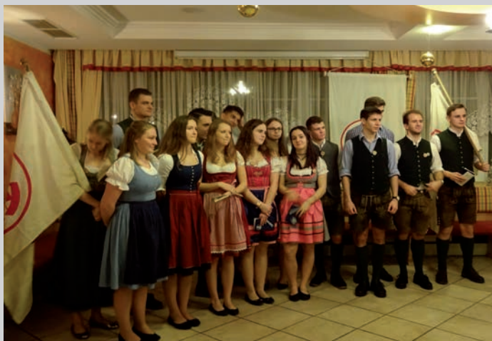
Die Bundesjugend singt „Es bließ ein Jäger“ zweistimmig

Am Abend, beim Volkstanzfest, waren zahlreiche Gäste aus Nah und fern vertreten, um gemeinsam ins neue Jahr zu tanzen.