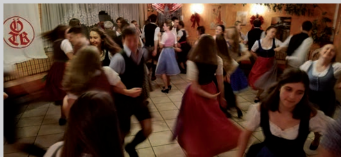
...und danach geht's gleich wieder rund auf der Tanzfläche

Die Bundesjugend präsentierte in einer Tanzpause ein mehrstimmiges Lied und zeigte einmal mehr, zu was begeisterte Jugendliche im Stande sind. Nach der taktvollen Woaf und dem gemeinsamen Schlusskreis, klang der Abend noch mit geselligen Liedern bis in die Morgenstunden aus.