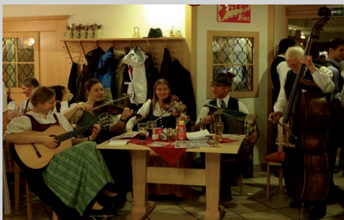
Die Salzkammergut Geigenmusi

Im Rahmen dieses Wochenendes wurde auch traditionell das Neujahrsvolkstanzfest gemeinsam mit dem Turnverein St. Georgen im Attergau durchgeführt. Bei der Feierstunde, die zuvor auf der örtlichen Turnwiese abgehalten wurde kam auch der nötigen Ernst nicht zu kurz.