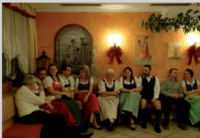
Zum sitzen kommt man nur in den Tanzpausen...

Großer Dank gilt auch der Salzkammergut Geigenmusik, die wie jedes Jahr musizierte und somit für einen schwungvollen und lustigen Tanzabend sorgte.